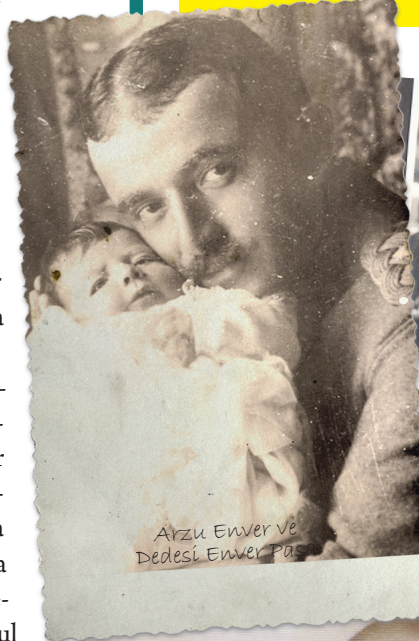
Arzu Enver ve Dedesi Enver Paşa

Ömer Eroğan ile evli ve Burak Enver adında bir oğlu var.