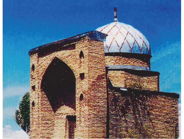
Hoca Ahmed Yesevi’nin Annesi Ayşe Hatun Karaşaş Ana Türbesi’de Sayram ilçesinde Cuma Mescidi haziresindedir. Ahmet Yesevi YEDİ yaşında babasını kaybedince Annesi Sayram merkezine gelip kardeşleri Mustafakulu ve Latif Ata’nın kabirleri de aynı hazirededir.